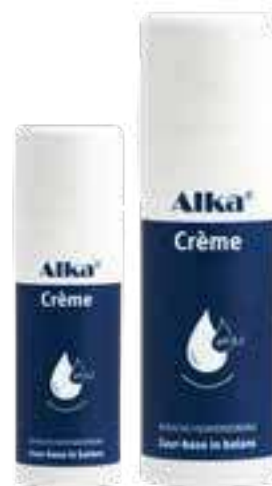
Verkrijgbaar in 50 ml en 150 ml Lucht- en lichtdichte tubes met doseerpomp

De unieke basische formule werkt daarbij verzachtend, hydraterend en verzorgend dankzij natuurlijke oliën en boters. De antioxidanten Co-enzym Q10 en Vitamine E in Alka® Crème beschermen de gezonde huidcellen en gaan optische veroudering tegen.